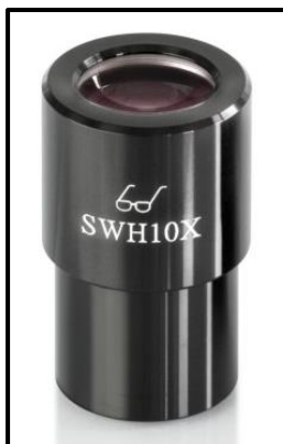
Oculare ad alto punto di vista (riconoscibile dal simbolo degli occhiali)