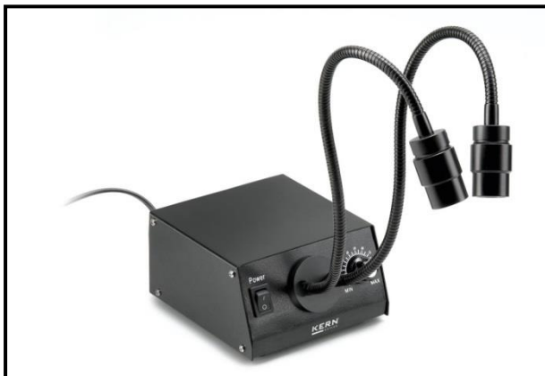
Illuminazione tipica a collo d'oca

Le unità di illuminazione adatte alla serie OZL-46 sono unità di illuminazione a collo d'oca (vedi illustrazione ). Possono essere in versione LED o alogena e hanno anche interruttori on/off o vari controlli.