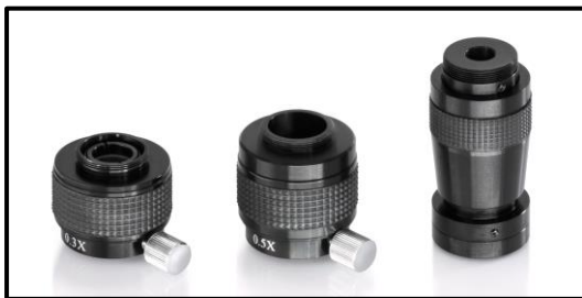
Adattatore di montaggio C

La fotocamera e l'adattatore sono collegati tramite la filettatura C-mount.